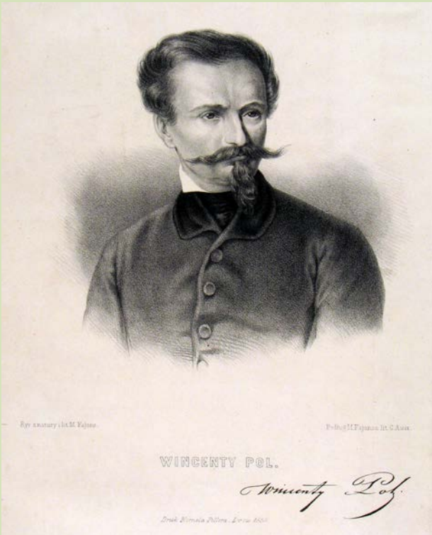
Wincenty POL (1807-1872)